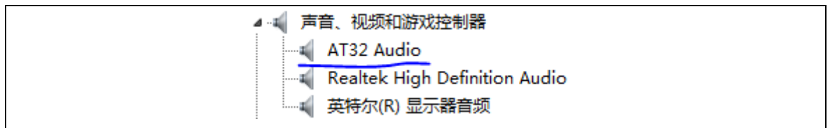
图 3. PC 端设备枚举